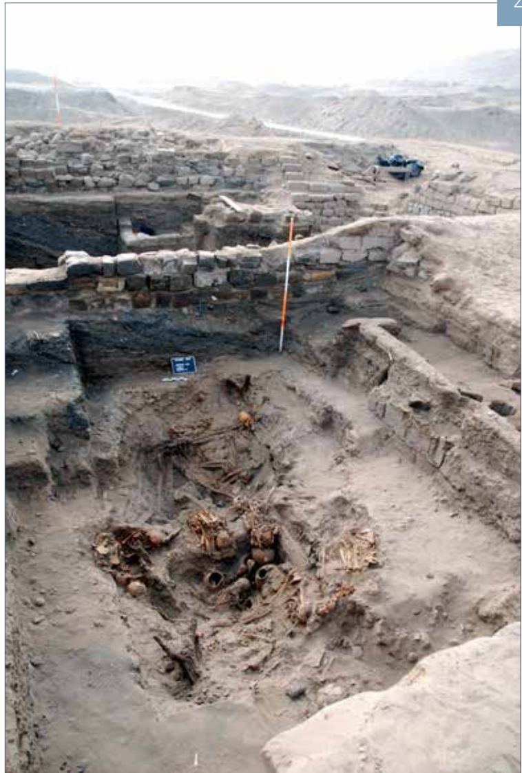
4. Chambre funéraire découverte dans le Cimetière 1 (2012)

Les coutumes funéraires et rituelles associées au site sont un autre domaine que nous avons largement exploré. Pachacamac, outre le secteur des palais, comporte une enceinte sacrée avec un Temple du Soleil et un temple dédié à Pachacamac, dieu créateur côtier, oracle, thaumaturge maître des tremblements de terre et gardien des défunts. Les conquistadores témoignent amplement du pèlerinage de masse dont il faisait l'objet. Tous ces aspects et d'autres ont été abordés au cours de nos recherches, notamment suite à la découverte de la nécropole (Cimetière I), dans une zone jusqu'alors réputée épuisée par les pillages. Cette découverte ouvre des perspectives immenses pour notre compréhension des sociétés andines. Près de 300 enterrements ont été fouillés depuis 2004. En 2012, une grande chambre funéraire de 20m 2 est apparue, totalement intacte (Fig. 4). Nous y avons découvert sur deux niveaux 94 squelettes et momies accompagnés de très nombreuses offrandes : vases en céramique, animaux (chien, cochons d'Inde), bijoux en cuivre et en alliage d'or, masques « fausses-têtes » en bois peint,alebasses, etc. Les bébés et très jeunes enfants sont largement majoritaires.