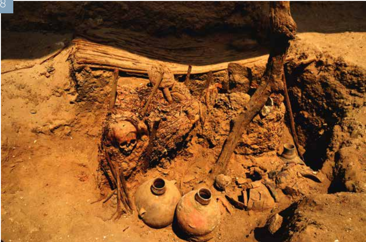
8. chambre funéraire (2014). De gauche à droite : un enfant, une femme (avec fausse-tête) et un homme (idem). Mobilier Ychsma ancien (XI-XIII e s. ap. JC).